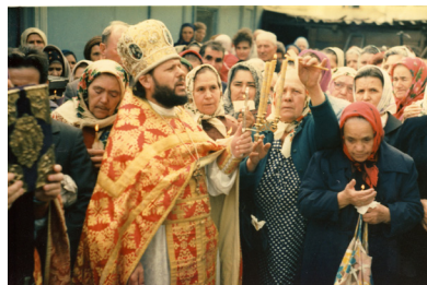
Sărbătoarea Sf. Paști la Biserica "Sfânta Treime", 1989