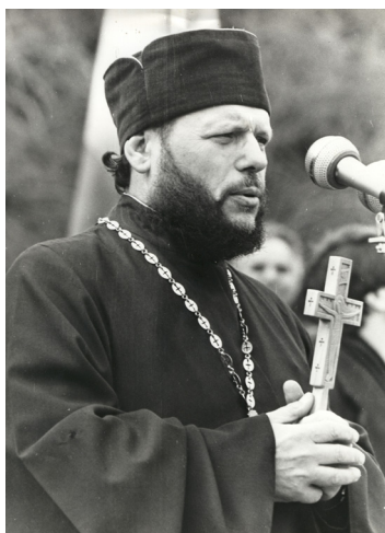
La miting, 1993