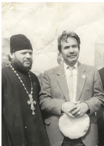
La miting cu poetul D. Matcovschi, 1993