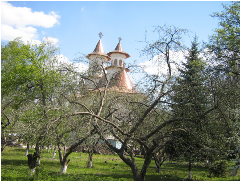
Biserica "Sfinții Apostoli Petru și Pavel"