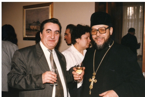
La Ambasada României, cu ocazia sărbătorilor de Crăciun, 26 septembrie, 1997