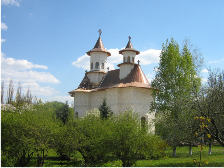
Biserica "Sfinții Apostoli Petru și Pavel"